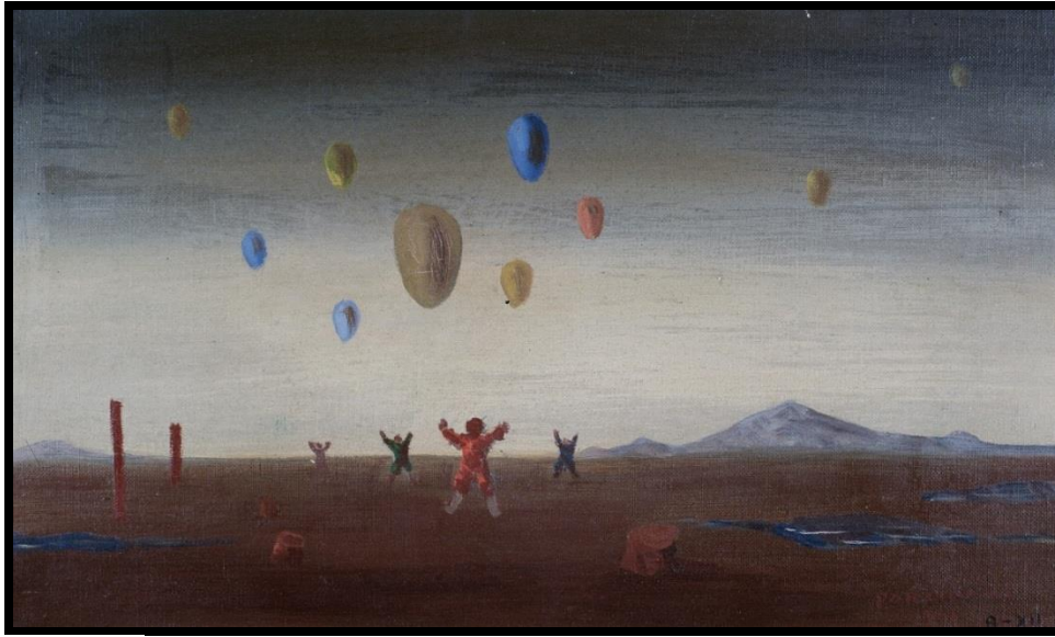
Cândido Portinari – Meninos com balões, 12/08/1951.